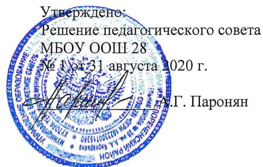
График учебного и каникулярного времени в МБОУ ООШ 28 имени А.А.Киркарьяна хутора Тернового на 2020 -2021 учебный год